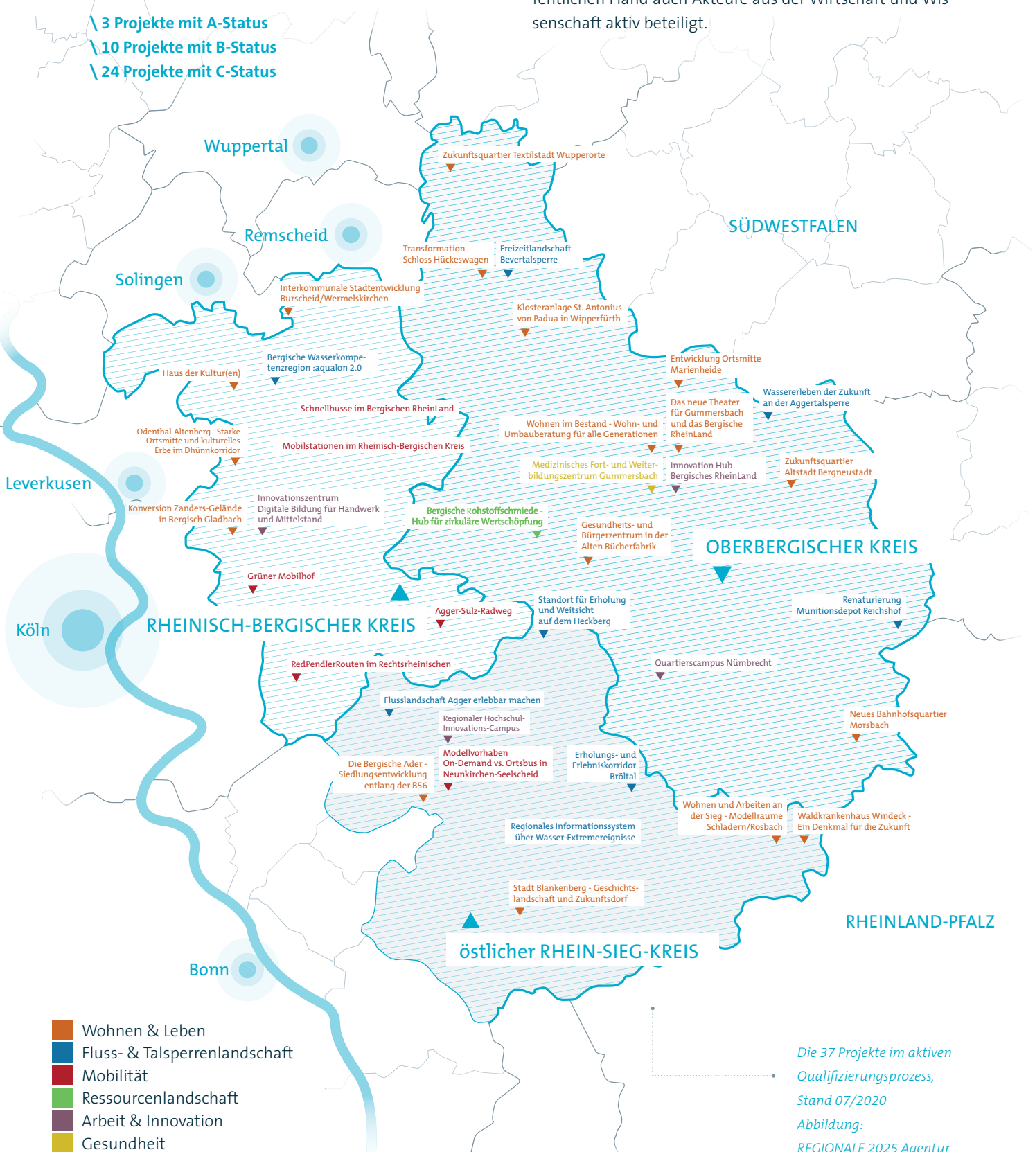
Die 37 Projekte im aktiven Qualifizierungsprozess, Stand 07/2020

Die Projektlandschaft deckt alle thematischen Handlungsfelder des Strukturprogramms ab und verteilt sich räumlich ausgewogen über die Raumkulisse des Bergischen Rheinlandes. In den Vorhaben und Prozessen sind neben der öffentlichen Hand auch Akteure aus der Wirtschaft und Wissenschaft aktiv beteiligt.